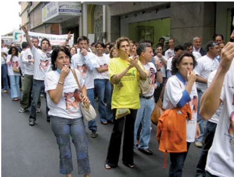
Servidores do MPU no Rio Grande do Sul ganham as ruas em manifestação por PCS digno para todos

O compromisso daquela nova Diretoria Nacional do SINASEMPU, desde que havia assumido a direção da entidade em 09.07.2005, era de fomentar e efetivamente implementar um trabalho conjunto com as Entidades Representativas do MPU, principalmente com as Associações de nível nacional, como é caso da ASMPF, ASEMPT e, no DF a ASMIP. Assim, considerando a primeira traição do SINDJUS-DF, o SINASEMPU, ASMPF E ASEMPT marcaram uma reunião com o secretário-geral do MPF, por quem foram recebidas no dia 05.10.05. Na ocasião foram tratados vários assuntos de interesse da categoria e, como não poderia deixar de ser, sobre o PCS. O relatório da aludida reunião foi publicado, à época, nos sites das respectivas entidades.