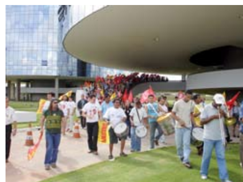
Ato em prol de um PCS digno, em 17/nov de 2005