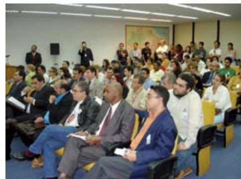
Diretores do SINASEMPU e servidores durante sessão do CNMP

Obs.: Por não ter participado do “seminário”, a então presidente do SINASEMPU, por iniciativa própria, e na maior boa vontade, encaminhou novas sugestões apenas de composição da tabela de vencimentos, na qual constasse apenas a