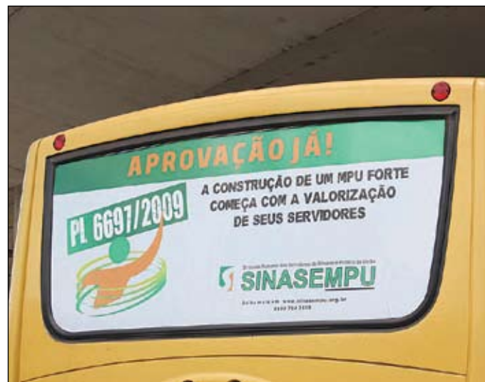
Carros e ônibus circulam por toda a cidade ampliando a visibilidade da campanha do SINASEMPU