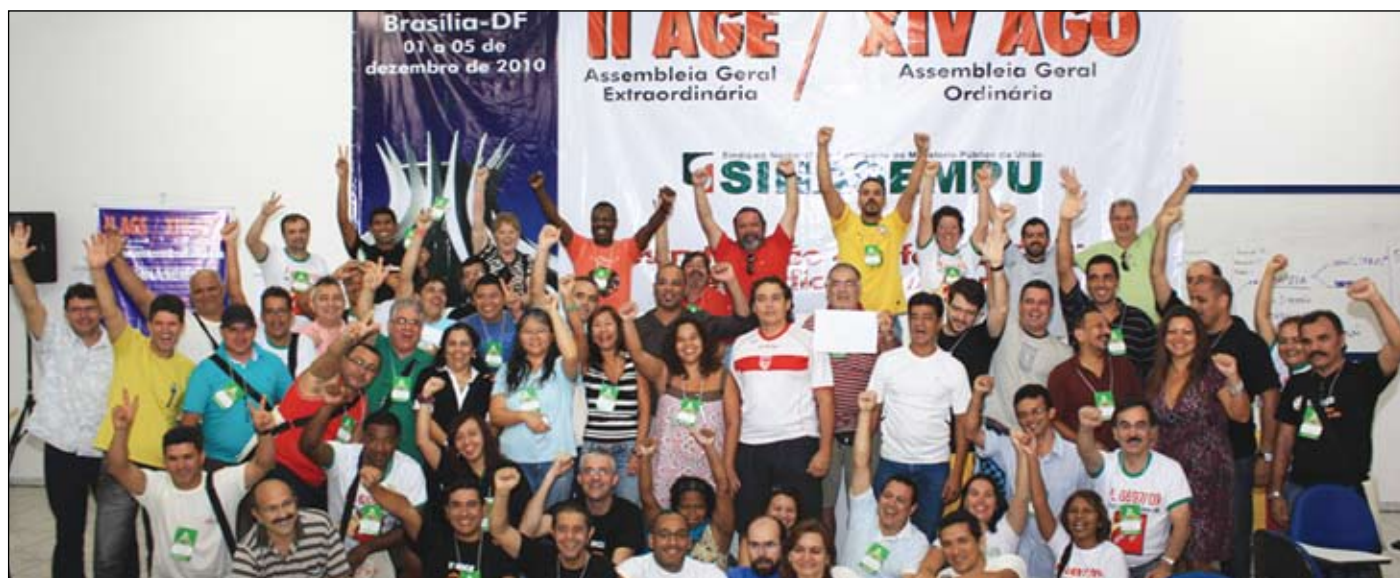
A XIV AGO foi marcada por um consenso que representa um novo tempo para o SINASEMPU

Os componentes da DENIN sabem que não têm o direito de se queixar de dificuldades – todos estavam conscientes delas ao aceitarem o encargo. Mas é sempre bom acreditar que o time não é só de sete: somos mais de dez mil servidores no MPU, divididos em duas categorias: filiados e AINDA não filiados.